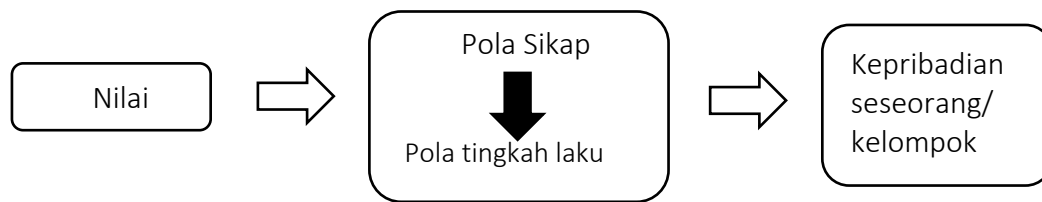
Gambar 2. Bagan Hubungan Antara Nilai, Sikap, Tingkah Laku, dan Kepribadian