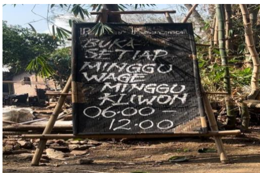
Gambar 1. Waktu Buka Wisata Pasar Keramat

Indonesia adalah negara yang kaya akan budaya dan gastronomi. Setiap daerah memiliki ciri dan ciri khas yang membuatnya menarik bagi wisatawan. Pacet, Mojokerto, merupakan salah satu tempat dengan wisata budaya dan gastronomi tradisional yang khas. Pasar Keramat terletak di sini, dan menawarkan suasana dan pengalaman berbelanja barang antik. Lokasi Pasar Keramat berada di Dusun Pong Boto, Kecamatan Pacet, Warugunung. Dusun Kramatjetak, tempat Pasar Keramat berada, menjadi sumber nama pasar tersebut. “ Keramut ben manfaat mugio kajugrukan rahmat so ngersani gusti kang maha rahmat ” adalah makna historis dari istilah suci (Nisaa, 2023). Pasar ini berdiri sejak tahun 2019 dan merupakan inisiatif dari masyarakat setempat yang bekerja sama dengan berbagai pihak. Seperti pernyataan yang dikatakan oleh informan “...Pasar keramat iki dirintis kaet tahun 2019 mbak tapi diresmikake nang tanggal 20 Februari 2023 dening Bupati Mojokerto, Ibu Ikfina Fahmawati. Alasan milih pasar keramat gae tempat dagang yaiku kanggo ngembangake potensi desa, ngurangi sampah plastik, nguri-uri budaya Jawa, lan ngundang wisatawan kanggo ngunjungi pasar keramat” (Pedagang makanan, 52 Tahun)