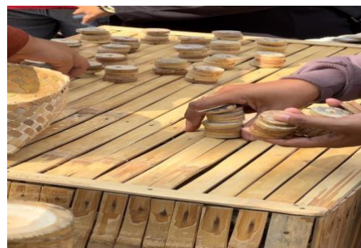
Gambar 2.. Koin Gobog

Gambar diatas dapat menggambarkan bahwa Pasar Keramat berbeda dengan pasar pada umumnya. Pasar ini hanya buka setiap dua minggu sekali, tepatnya pada hari Minggu Wage dan Kliwon menurut penanggalan Jawa. Jam operasionalnya pun hanya dari pukul 06.00 hingga 12.00 WIB. Selain itu, pasar ini berada di tengah hutan bambu yang asri dan sejuk. Para pedagang menggunakan bambu sebagai tempat dagangan dan peralatan memasak. Mereka juga mengenakan pakaian tradisional seperti blangkon, jarik, dan kebaya. Yang paling menarik dari Pasar Keramat adalah transaksi jual beli yang tidak menggunakan uang, melainkan koin gobog. Koin gobog adalah koin logam yang berbentuk persegi dan berlubang di tengahnya. Koin ini merupakan mata uang yang digunakan pada zaman kerajaan Majapahit. Nilai satu koin gobog sama dengan Rp 2.000. Para pengunjung yang ingin berbelanja di Pasar Keramat harus menukarkan uangnya dengan koin gobog terlebih dahulu.