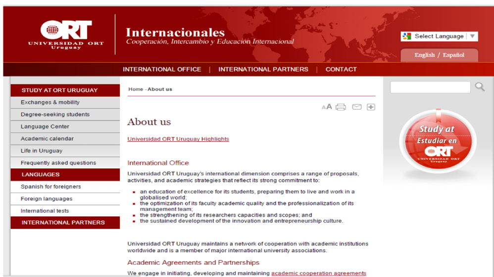
Gambar 2. Website Universitas ORT Uruguay

tetapi ada yang masih menggunakan bahasa Spanyol. Hal tersebut mengindikasikan bahwa, website ini belum didesain seutuhnya untuk orientasi jangka yang panjang. Selain pihak yang mampu berbahasa Spanyol belum diakomodir seutuhnya untuk dapat mengakses website ini dengan lancar. Namun, terdapat halaman “ career ” yang menunjukkan bagaimana kemungkinan karir yang dapat ditempuh oleh lulusan ini.