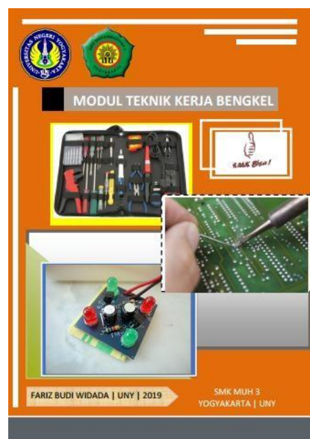
Gambar 2. Modul Kerja Bengkel