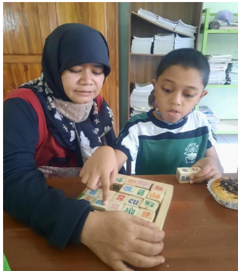
Gambar 3. Metode Auditori yang dilaksanakan pada siswa disleksia