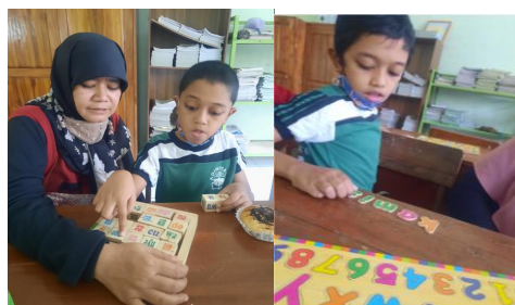
Gambar 5. Media yang digunakan sebagai alat bantu membaca pada siswa disleksia

Hasil wawancara, observasi, dan dokumentasi mengenai penerapan metode multisensori pada siswa disleksia menunjukkan fakta-fakta empirik. Adapun upaya yang dilakukan oleh orang tua dan guru kelas untuk mengajarkan subjek membaca adalah dengan menerapkan sebuah metode membaca