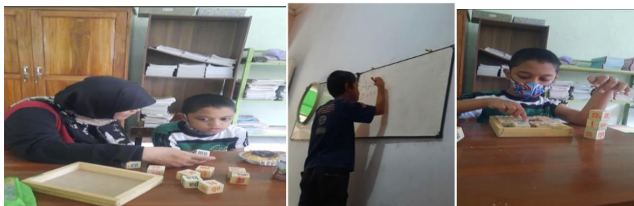
Gambar 4. Metode Kinestetik dan taktikal yang dilaksanakan pada siswa disleksia