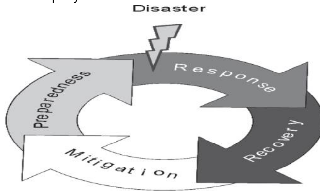
Gambar 3. Siklus Mitigasi Bencana oleh FEMA dalam Hans Günter Brauch et al., (2011)

Mengedepankan penyelamatan jiwa menjadi prioritas utama dalam menghadapi bencana. Perlindungan keamanan, kesehatan, penyediaan fasilitas dan infrastruktur untuk kelangsungan hidup seperti ketersediaan air bersih, dan keamanan pangan hendaklah menjadi prioritas setelah penyelamatan.