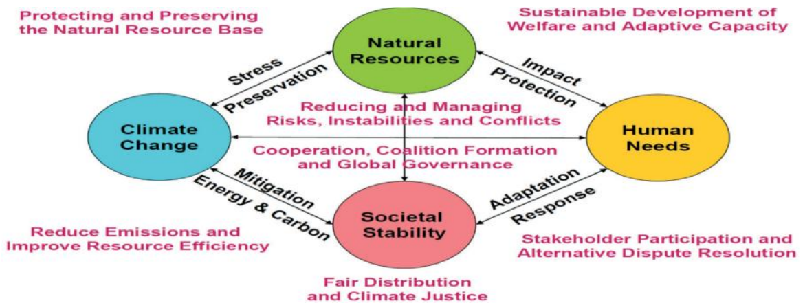
Gambar 2. Strategi Penyelamatan Terhadap Bencana Dengan Kerangka kerja Terintegrasi (Hans Günter Brauch et al., 2011)

hilangnya perlindungan sosial, menurunnya derajat kesehatan, hilangnya harta benda, kekacauan jaringan sosial dan kelembagaan (Omar D. Cardona, 2011). Kondisi demikian hanya akan dapat ditangani dengan baik apabila terjadi kesiapan masyarakat untuk menghadapi bencana. Mengenai strategi penyelamatan terhadap bencana secara terintegrasi dapat dilihat pada Gambar 2 berikut