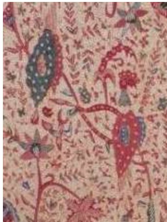
Gambar 1. Contoh pengubahan pada batik Rifa'iyah

Pendekatan AiE pada Batik Rifa'iyah diwujudkan melalui corak, motif, dan proses pembuatan Batik Rifa'iyah. Menurut (Jaeni, 2017, p. 13), corak dalam batik Rifa'iyah sangat menghindari gambar-gambar makhluk hidup, seperti halnya gambar-gambar hewan. Penggambaran hewan seperti halnya burung, tidak boleh utuh secara struktur bentuk. Aturan tentang penggambaran motif makhluk hidup diimplementasikan dengan melakukan pengubahan pada motif hewan. Pengubahan tersebut biasanya dilakukan dengan menghilangkan atau mengganti bagian tubuh objek makhluk hidup dengan objek gambar yang lain, sehingga objek makhluk hidup tidak terbentuk secara utuh.