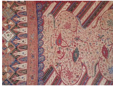
Gambar 2. Motif Pelo Ati pada batik Rifa'iyah

Mustika menyampaikan bahwa motif pelo ati menjadi gambaran dari ajaran sufisme K.H. Ahmad Rifa'i yang disuratkan dalam kitab Tarujumah (Asnal Miqashad 11:407) karya K.H. Ahmad Rifa'i. Motif pelo ati atau dalam bahasa Indonesia berarti hati dan ampela berisi pesan bahwa hati manusia memiliki delapan sifat kebaikan yaitu; zuhud (tidak mementingkan keduniawian), qana'at (merasa cukup atas karunia-Nya), shabar (sabar), tawakal (berserah diri kepada-Nya), mujahadah (bersungguh-sungguh), ridla (rela), syukur, dan ikhlas. Makna kahauf (takut), mahabbah (rasa cinta), dan makrifat (perenungan kepada Allah) terkandung dalam sifat-sifat kebaikan.