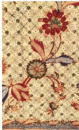
Gambar 3. Batik Rifa'iyah motif Kawung Jenggot

Motif batik yang digambar peserta didik menggunakan motif sederhana yakni motif kawung jenggot , yang juga merupakan salah satu motif dari Batik Rifa'iyah. Motif kawung jenggot pada batik Rifa'iyah dapat dilihat pada gambar nomor 3.