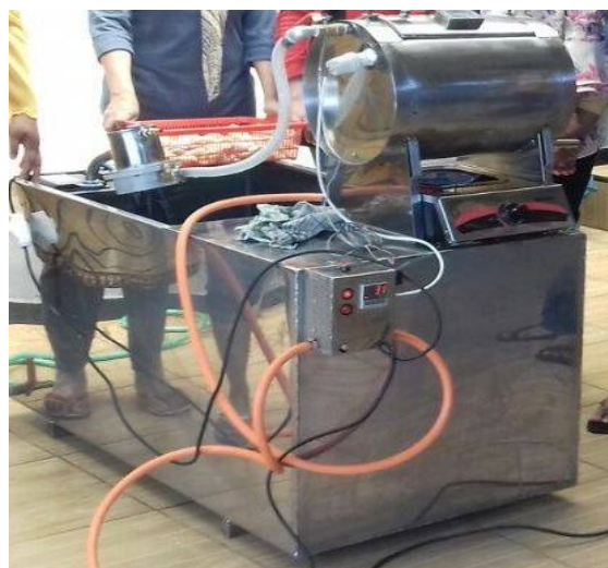
Gambar 1. Mesin Pengolah

Salak yang sudah dicuci selanjutnya dilakukan proses penggorengan dengan menggunakan mesin penggoreng kedap udara ( Vacum Frying ) yang sudah diisi minyak goreng. Keripik salak digoreng pada mesin vacum frying selama 1,5 jam dengan tekanan -68 cmHg. (6) Selanjutnya, keripik yang telah kering akan dilakukan proses penirisan dan pengemasan dengan menggunakan aluminium foil kemudian siap dipasarkan.