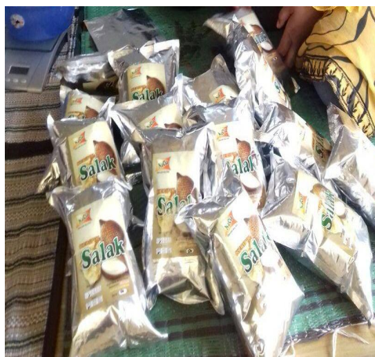
Gambar 2. Kemasan Keripik Salak

Pengolahan buah salak di atas secara singkat dapat dilihat pada Gambar 3.