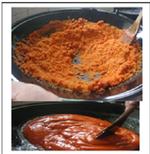
Gambar 3. Proses Pembuatan Minuman Instan