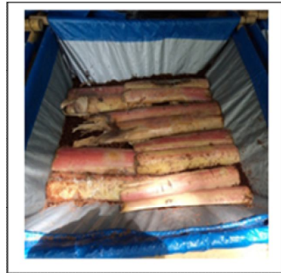
Gambar 2. Media Ditutup Batang Pisang untuk Kenyamanan Cacing

Budidaya cacing dilakukan dengan menggunakan 2 kg induk cacing, namun belum bisa panen dengan baik. Kegagalan budidaya cacing yang dikerjakan oleh peserta didik selanjutnya dievaluasi dan dicari solusinya. Peserta didik juga diberikan pemahaman bahwa berwirausaha terkadang juga mengalami kegagalan terlebih dahulu dan justru dengan kegagalan biasanya merupakan langkah awal menuju kesuksesan.