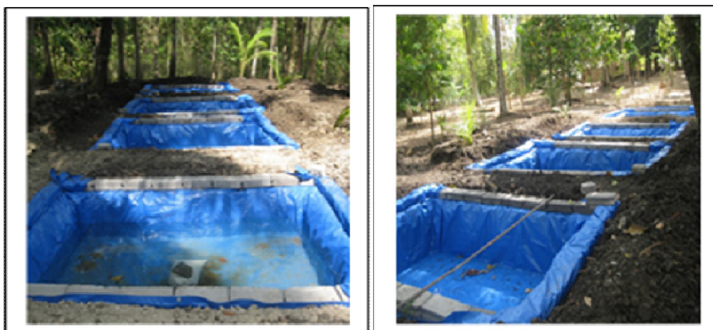
Gambar 1. Kolam yang Disiapkan untuk Belajar Budidaya Lele

Setelah terpal dipasang, selanjutnya, diisi air sampai kurang lebih separuh dari permukaan atas. Setelah itu, diberi pasir yang telah diisikan pada karung untuk meningkatkan pH air sekaligus sebagai pemberat. Air dibiarkan selama 3 hari. Bibit ikan ditaburkan masing-masing 1000 ekor untuk satu kolam.