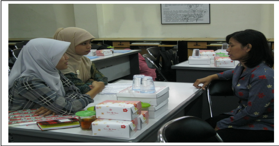
Gambar 2. Perencanaan Alat Pembelajaran Fisika antara Mahasiswa PPL dan Guru Pembimbing PPL Matapelajaran Fisika