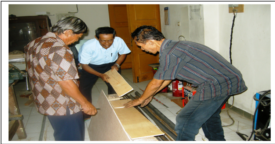
Gambar 3. Perencanaan Penggunaan Bahan Triple untuk Pembuatan Alat Pembelajaran Fisika oleh Pemulung Terdidik

berada di sekitar kita. Pada kegiatan workshop setiap peserta diberi kesempatan untuk mengajukan ide/gagasan, pertanyaan-pertanyaan seputar pemanfaatan bahan daur ulang sebagai bahan utama alat peraga fisika serta mencoba membuat dan