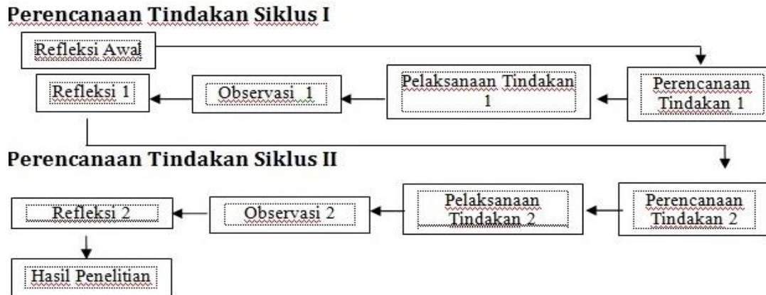
Bagan Desain Penelitian Tindakan Kelas Model Modifikasi Depdiknas dari Model Kemmis dan Taggart