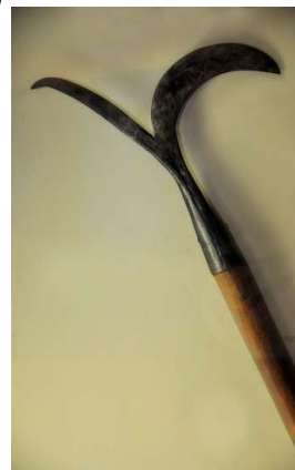
Gambar 1. Angkus , salah satu peralatan kehutanan tradisional

kehutanan sebagai media pembelajaran. Selain sebagai media pembelajaran sumber sejarah, koleksi tersebut juga dapat digunakan sebagai media pembelajaran pada materi sejarah peminatan, mengenai kehidupan manusia pada masa bercocok tanam. Meskipun hanya merupakan tiruan saja, namun melalui benda koleksi ini peserta didik dapat mengetahui jenis sumber sejarah sekunder.