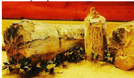
Gambar 2. Fosil kayu jati yang telah membatu

Pada pembelajaran sejarah, materi sumber sejarah sub-materi fosil, guru sejarah dapat menggunakan koleksi museum, fosil kayu jati yang sudah membatu sebagai media pembelajaran. Koleksi ini selain sebagai media pembelajaran pada materi sumber sejarah, juga dapat digunakan sebagai media pembelajaran pada materi manusia purba di Indonesia ketika membahas kondisi lingkungan tempat tinggal manusia purba. Peserta didik dapat menggolongkan benda koleksi ini sebagai sumber sejarah primer.