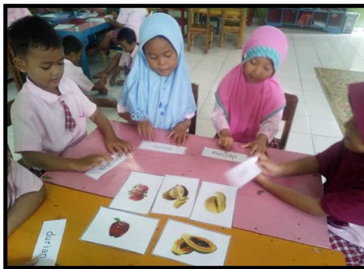
Gambar 5. Anak menyebutkan lambang-lambang huruf