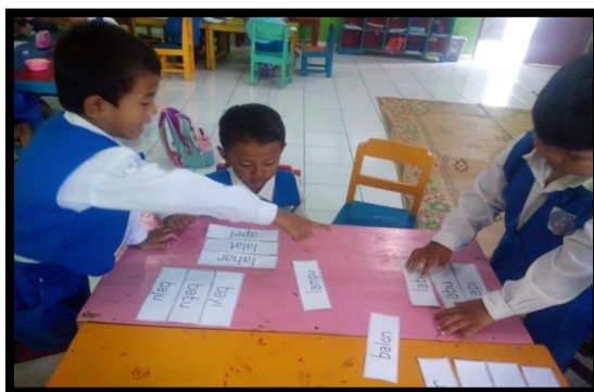
Gambar 3. Anak mengelompokkan kartu kata bersuku kata awal sama