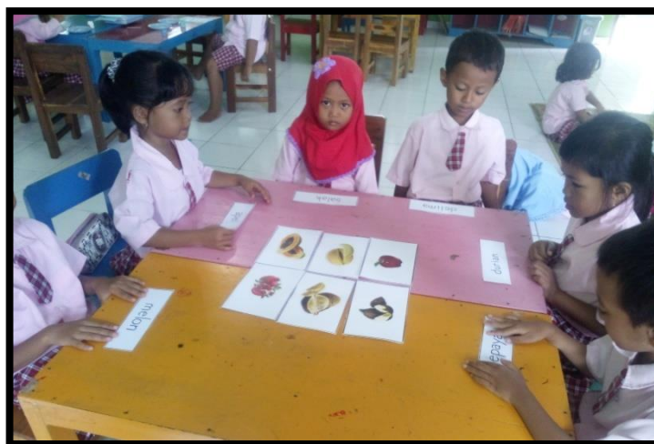
Gambar 4. Anak mengamati kartu kata yang dimiliki

Pertemuan pertama dilaksanakan pada hari Rabu tanggal 6 Maret 2019 untuk kemampuan menempelkan kartu kata pada gambar yang sesuai. Adapun langkah-langkah bermain kartu kata bergambar antara lain, guru menunjukkan kartu kata satu persatu dengan menunggu sampai anak tahu tiap kata sebelum beralih ke kartu berikutnya. Guru menunjukkan kartu bergambar satu demi satu pada anak, anak diminta menyebutkan nama gambar tersebut, guru membagi kartu kata pada anak, posisi tulisan ada di bawah. Guru menata kartu bergambar bersampingan di atas meja, dengan aba-aba guru anak membuka kartu kata masing-masing. Guru memberi waktu pada anak untuk mengenali kartu kata yang dibawa, secara bergantian anak mencari gambar sesuai dengan kartu kata yang dimilikinya. Guru meminta anak menyebutkan lambang-lambang huruf. Guru meminta anak mengulang membaca kartu kata tersebut. Guru meminta anak menyebutkan kata yang mempunyai suku kata awal yang sama sesuai kartu kata yang dimilikinya.