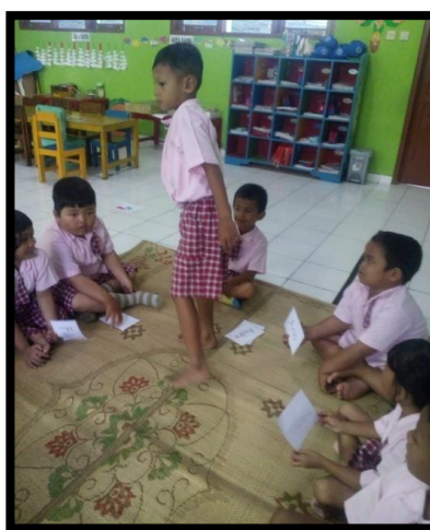
Gambar 2. Anak sedang mencari kartu nama yang dipegang teman

Pertemuan kedua dilaksanakan pada hari Senin tanggal 25 Februari 2019 untuk kemampuan mencari pasangan kartu kata dengan kartu gambar dan membacanya. Guru menyampaikan tema hari ini yaitu masih membicarakan tentang gunung meletus. Anak-anak diajak bercakap-cakap tentang banjir lahar dingin, dan guru menjelaskan kegiatan yang akan dilaksanakan di area-area, termasuk di area keaksaraan bermain dengan kartu kata bergambar. Adapun langkah-langkah bermain kartu kata bergambar antara lain: