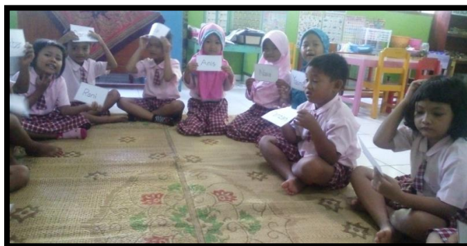
Gambar 1. Anak menunjukkan kartu kata yang memuat namanya