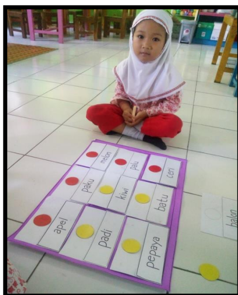
Gambar 6. Anak membuat barisan kata

Pertemuan kedua dilaksanakan pada hari Sabtu tanggal 09 Maret 2019 untuk kemampuan membuat barisan kata. Adapun langkah-langkah bermain membuat barisan kata antara lain: guru menunjukkan kartu kata satu persatu dengan menunggu sampai anak tahu tiap kata sebelum beralih ke kartu kata berikutnya, guru menunjukkan papan karton tebal berbentuk persegi panjang, terbagi menjadi sembilan kotak, guru menumpuk kartu-kartu kata dengan sisi kata menghadap ke atas, guru minta 2 anak bergiliran mengambil sebuah kartu kata dan membaca kata pada kartu itu, kemudian melihat sebaliknya untuk mengecek apakah anak membaca dengan benar, anak meletakkan kartu bergambar pada ruang di papan karton tebal dan meletakkan sebuah keping di atasnya. Tiap pemain menggunakan keping dengan warna berlainan dan sasaran permainan adalah membuat suatu barisan tiga keping dengan warna yang sama, sepanjang garis-garis” bujur dan silang”. Jika belum berhasil, kocok-kocok kartu itu dan mulai lagi.