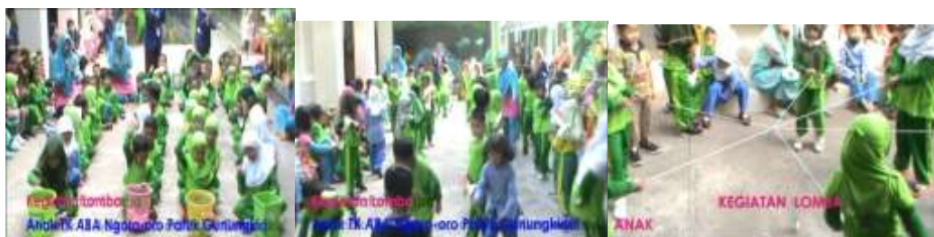
Gambar 6. Lomba permainan

Waktu pelaksanaan 120 menit dengan alat dan bahan yang digunakan bola plastik, keranjang, bendera, benang, pensil, botol bekas sirup. Kegiatan Pembelajaran diawali dengan berdiskusi tentang perayaan peringatan Hari Ulang Tahun Republik Indonesia. Kemudian dilanjutkan menonton video tentang kegiatan perayaan Hari Ulang Tahun Republik Indonesia. Berdiskusi dengan peserta didik tentang permainan yang akan dilakukan. Guru menggunakan kalimat pemantik antaralain; Apa yang kamu ketahui tentang permainan peringatan perayaan Hari Ulang Tahun Republik Indonesia?; Permainan apa saja yang kamu mainkan untuk memperingati Hari Ulang Tahun Republik Indonesia? ; dan Bagaimana caramu mengikuti permainan peringatan Hari Ulang Tahun Republik Indonesia?. Kegiatan permainan perayaan peringatan Hari Ulang Tahun Republik Indonesia yang dilakukan yaitu bermain estafet bendera, merantingkan bola, dan memasukan pensil ke dalam botol.