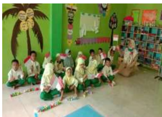
Gambar 4. Berkreasi membuat bendera merah putih

Waktu pelaksanaan 120 menit dengan alat dan bahan yang digunakan Video tentang bendera merah putih, stik bambu, kertas, krayon, sedotan, dan lem. Kegiatan Pembelajaran diawali dengan berdiskusi tentang Hari Ulang Tahun Republik Indonesia. Kemudian dilanjutkan untuk menonton video tentang bendera negara Indonesia. Berdiskusi dengan peserta didik tentang bendera Merah Putih. Guru memberikan kalimat pemantik antarlain Apa yang kamu ketahui tentang bendera Indonesia?; Bendera seperti apa yang ingin kamu kreasikan?. Anak diberikan kesempatan berkreasi membuat bendera merah putih.