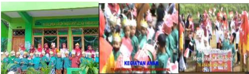
Gambar 7. Karnaval

Waktu pelaksanaan 120 menit dengan alat dan bahan yang digunakan kostum sesuai dengan drescode kesepakatan kelas, spanduk, bendera, tape recorder. Kegiatan Pembelajaran diawali dengan berdiskusi tentang kegiatan karnaval kemerdekaan dan dilanjutkan dengan menonton video tentang kegiatan karnaval. Berdiskusi dengan peserta didik tentang karnaval yang akan dilakukan. Guru menggunakan kalimat pemantik; Apa yang kamu ketahui tentang kegiatan karnaval?; Kostum apa yang ingin kamu pakai untuk mengikuti karnaval?; dan Bagaimana caramu mengikuti karnaval?. Kegiatan karnaval diikuti oleh peserta didik, guru, dan wali murid dengan berjalan kaki dari kompleks TK ABA Ngoro-oro menuju Lapangan Ngoro-oro dan Kembali ke TK ABA Ngoro-oro.