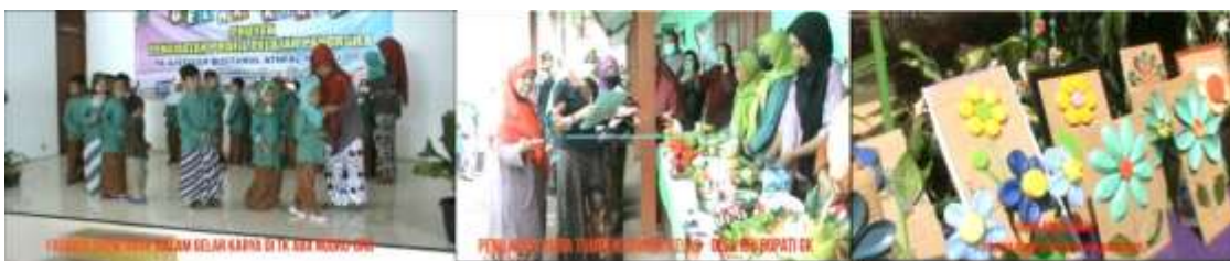
Gambar 8. Gelar Karya

Gambar 8 merupakan kegiatan anak gelar karya dengan kegiatan fashion show, gelar hasil karya anak, dan lomba tumpeng. Gelar karya anak bertujuan membentuk karakteristik peserta didik pada dimensi berkebhinekaan global elemen refleksi dan bertanggungjawab terhadap pengalaman berkebhinekaan sub elemen menyelaskan perbedaan budaya untuk mewujudkan capaian akhir fase fondasi yaitu mengetahui adanya budaya yang berbeda di lingkungan sekitar, dimensi mandiri elemen regulasi diri sub elemen percaya diri, Tangguh (resilient) dan adaptif untuk mewujudkan capaian akhir fase fondasi yaitu berani mencoba untuk tidak mudah menyerah saat mendapatkan tantangan, serta dimensi kreatif elemen menghasilkan karya dan tindakan yang orisinal sub elemen mengeksplorasi dan mengekspresikan pikiran dan/atau perasaannya dalam bentuk karya dan/atau tindakan sederhana serta mengapresiasi karya dan tindakan.