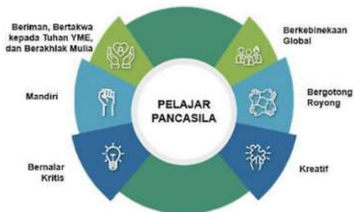
Gambar 1. Enam dimensi profil pelajar pancasila

TK ABA Ngoro-oro merupakan sekolah penggerak Angkatan 2, oleh karena itu sudah menggunakan Kurikulum Merdeka. TK ABA Ngoro-oro telah mempunyai Kurikulum operasional sekolah (KOSP) yang dirancang sesuai dengan karakteristik peserta didik, karakteristik lingkungan sekolah, dan potensi lingkungan.