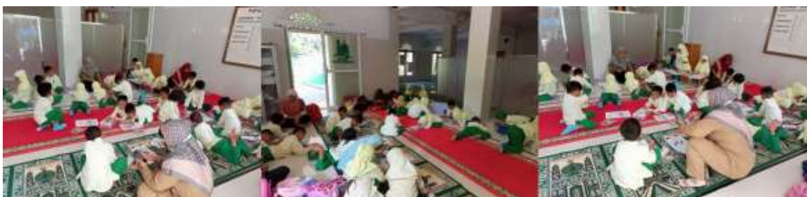
Gambar 5. Lomba mewarnai

Waktu pelaksanaan 120 menit dengan alat dan bahan yang digunakan kertas gambar, krayon, dan spidol. Kegiatan Pembelajaran diawali dengan berdiskusi tentang kegiatan lomba mewarnai gambar. Guru memberikan kalimat pemantik: Apa yang kamu ketahui tentang peringatan HUT RI?; Kegiatan apa saja yang ingin kamu lakukan untuk merayakan HUT RI?; dan Bagaimana caramu mewarnai gambar ?. Setelah itu anak diberikan kesempatan berkreasi lomba mewarnai gambar tema Hari Ulang Tahun Republik Indonesia.