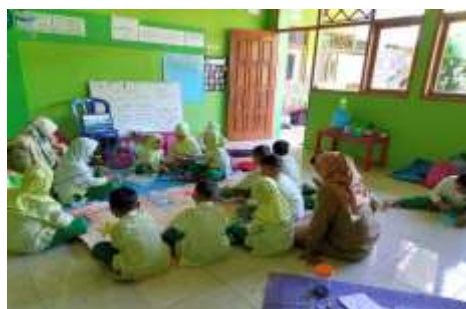
Gambar 3. Menonton video tentang HUT RI

Gambar 3 merupakan kegiatan anak menonton video tentang HUT RI dengan tujuan membentuk karakter peserta didik pada dimensi beriman, bertakwa kepada Tuhan Yang Maha Esa, dan berakhlak mulia elemen akhlak bernegara sub elemen melaksanakan hak dan kewajiban sebagai warga negara Indonesia untuk mewujudkan capaian akhir fase fondasi yaitu mengenali hak dan tanggungjawabnya di rumah dan sekolah, serta kaitannya dengan keimanan kepada Tuhan Yang Maha Esa, serta kaitannya dengan keimanan kepada Tuhan Yang Maha Esa, dimensi bergotong-royong elemen kolaborasi sub elemen komunikasi untuk mencapai tujuan bersama untuk mewujudkan capaian akhir fase fondasi yaitu menyimak sederhana dan mengungkapkannya dalam bahasa lisan, serta dimensi berpikir kritis elemen memperoleh dan memproses informasi dan gagasan sub elemen mengidentifikasi, mengklarifikasi dan mengolah informasi dan gagasan untuk mewujudkan capaian akhir fase fondasi yaitu mengidentifikasi dan mengolah informasi dan gagasan sederhana.