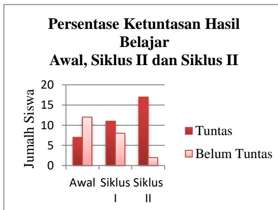
Gambar 3. Diagram Persentase Ketuntasan Hasil Belajar Awal, Siklus I, dan Siklus II

Dari tabel di atas menunjukkan bahwa persentase ketuntasan siswa meningkat dari data awal sebelum tindakan ke siklus I dan meningkat lagi pada siklus II. Persentase ketuntasan siswa di awal adalah 36,84% sementara persentase ketuntasan pada siklus I adalah 57,89% kemudian meningkat lagi pada siklus II yaitu sebesar 89,47 %. Peningkatan ketuntasan hasil belajar siswa juga diikuti dengan peningkatan rata-rata kelas dari data awalnya 66 meningkat pada siklus I yaitu 70 kemudian meningkat lagi pada siklus II sebesar 81. Apabila digambarkan dalam diagram maka persentase ketuntasan siswa dari data awal, siklus I, dan siklus II sebagai berikut.