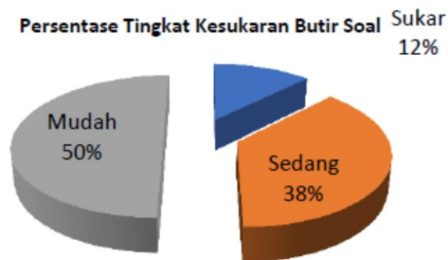
Gambar 1. Diagram Pie Persentase Tingkat Kesukaran Butir Soal

Kemudian bila dilihat dalam diagram lingkaran hasil analisis butir soal pilihan ganda Mata Pelajaran Pendidikan Jasmani Olahraga dan Kesehatan Kelas VIII SMP N 1 Ngemplak adalah sebagai berikut: