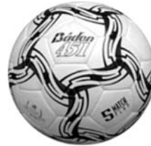
Gambar 3. Bola futsal