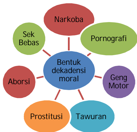
Gambar: 1. Deskripsi Dekadensi Moral Generasi