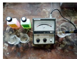
Gambar 3. Uji pH

Tahap ketiga yaitu analisis / uji kualitas air hasil pengolahan dan evaluasi program. Air harus memenuhi kualitas tertentu. Berbagai parameter harus dipenuhi agar air dapat diminum atau digunakan. Untuk mengontrol kualitas air minum yang diperoleh maka dilakukan serangkaian uji kimia dan biologi (bakteriologi), serta fisik yang berupa kekeruhan terhadap air. Uji kimia meliputi penentuan kadar ion-ion logam besi, mangan, dan uji pH. Uji fisika yaitu uji kekeruhan dengan mengukur TSD (total solid dissolve). Sedangkan uji bakteriologi yaitu dengan menguji bakteri Escherichia coli dalam air. Adapun cara-cara analisis kimia, fisika dan biologi menggunakan metode standar analisis Amerika (ASTM). Analisis dilakukan di laboratorium kimia UNY dan Laboratorium BBTCLPP Yogyakarta.