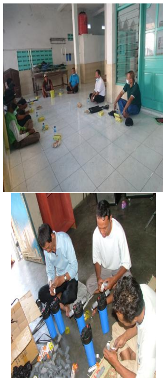
Gambar 7. Pelatihan dan Pembuatan Alat

Dengan adanya pelatihan tersebut maka akan meningkatkan ketrampilan warga Desa Tegalyoso untuk secara mandiri mampu membuat alat pengolahan air.