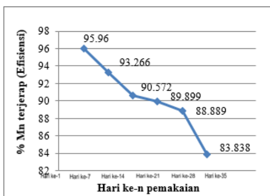
Gambar 9. Grafik Efektivitas Adsorpsi Mangan

Berdasarkan hasil analisis air, kandungan besi dan mangan menurun dengan adanya pengolahan air dengan kolom adsorpsi. Menurunnya kandungan besi dan mangan pada air sumur hasil adsorpsi akan lebih memenuhi baku mutu air sehingga lebih aman untuk dikonsumsi karena nilainya semakin jauh dari ambang batas yang ditetapkan permenkes RI N0.492/MENKES/PER/IV/2010.