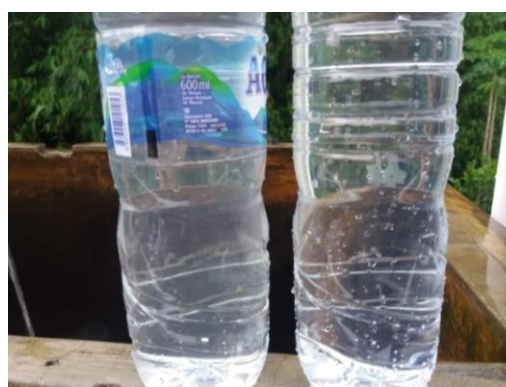
Gambar 9. Hasil Analisis (Dilihat dari Kejernihan)

Air yang dihasilkan dari pengolahan melalui kolom adsorpsi tidak lagi keruh maupun berbau, air lebih jernih serta bebas dari bahan-bahan pengotor yang dapat mempengaruhi kejernihan air. Hasil analisis air dilihat dari kondisi fisik air (kejernihan) dapat dilihat pada gambar 9.