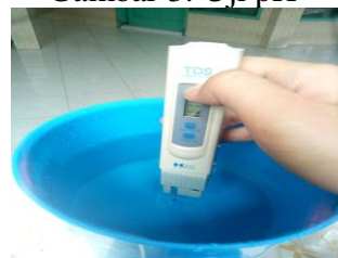
Gambar 4. Uji TDS