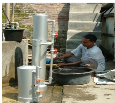
Gambar 2. Pembuatan Kolom

Tahap Kedua yaitu setting dan contruksi teknologi pengolahan air, dimana kolom yang telah dibuat