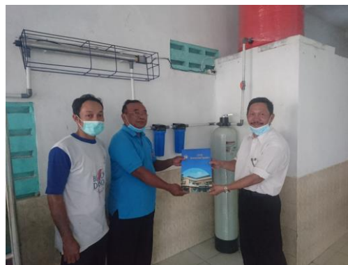
Gambar 10. Penyerahan Alat Pengolahan Air secara Simbolik

Diharapkan alat pengolahan air yang telah dibuat dapat secara efisien dan efektif digunakan warga dalam kurun waktu yang lama. Sehingga kebutuhan air bersih di Desa Tegalyoso Prawatan Klaten ini dapat terpenuhi, dengan begitu akan berdampak pula pada perekonomian bagi warga, yaitu penghematan biaya karena tidak perlu lagi untuk membeli air bersih. Warga cukup merawat alat serta menerapkan teknologi pengolahan ini untuk mendapatkan air bersih yang aman dikonsumsi. Oleh sebab itu selaku ketua kegiatan bersama anggota PPM menyerahkan secara simbolik kepada mitra alat pengolahan air minum yang telah dibuat, agar bisa dirawat setiap saat dan bisa digunakan dengan baik untuk keperluan pengolahan air sehari-hari. Berikut penyerahan ketua kegiatan kepada mitra secara simbolik,