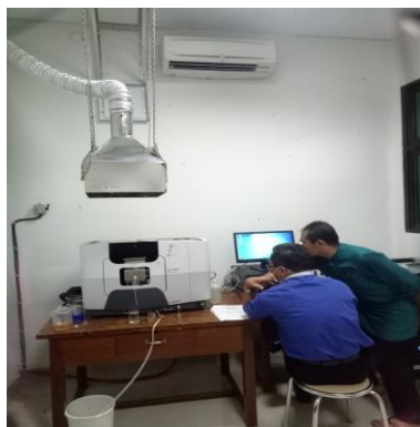
Gambar 5. Uji AAS

Adapun langkah-langkah keseluruhan untuk kegiatan ini adalah: