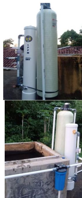
Gambar 6. Kolom Adsorpsi

Hasil utama dari kegiatan ini berupa kolom, sebuah alat yang dapat menyerap berbagai kandungan logam berbahaya ataupun kandungan bakteri. Alat tersebut berbentuk set alat kolom adsorpsi yang dilengkapi dengan adsorben berupa zeolit alam dan arang aktif. Rangkaian Alat tersebut dibuat dalam skala lapangan.