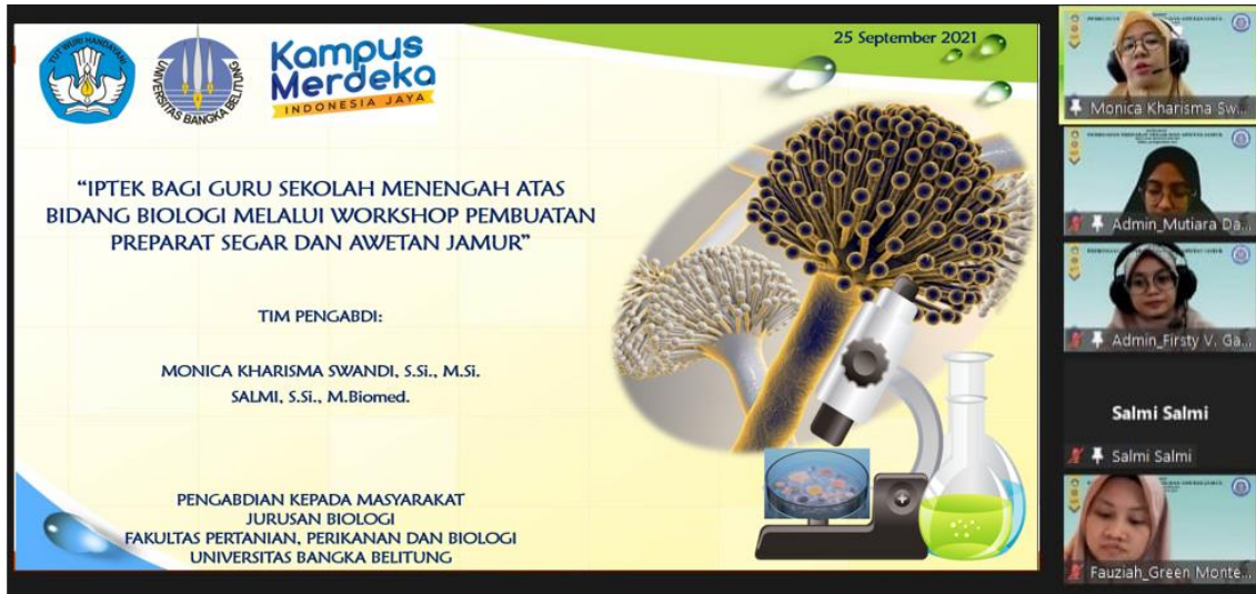
Gambar 1. Materi PPT oleh narasumber pelatihan

t-test menunjukkan bahwa pemberian pelatihan secara signifikan dapat meningkatkan pengetahuan guru Biologi SMA dalam membuat preparat segar dan awetan jamur mikroskopik ( p < 0.05 ).