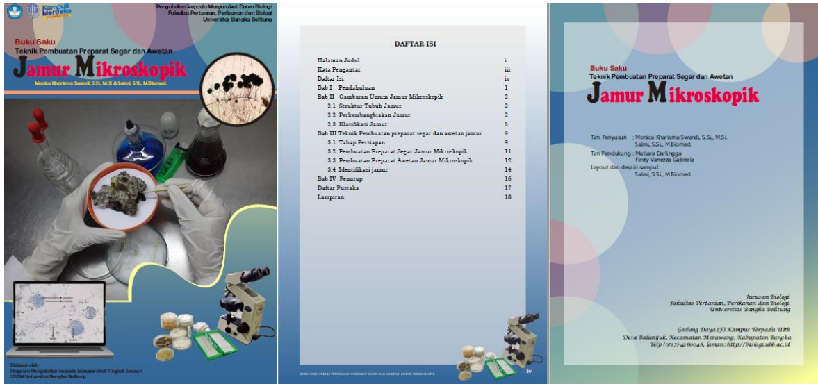
Gambar 3. Layout buku saku