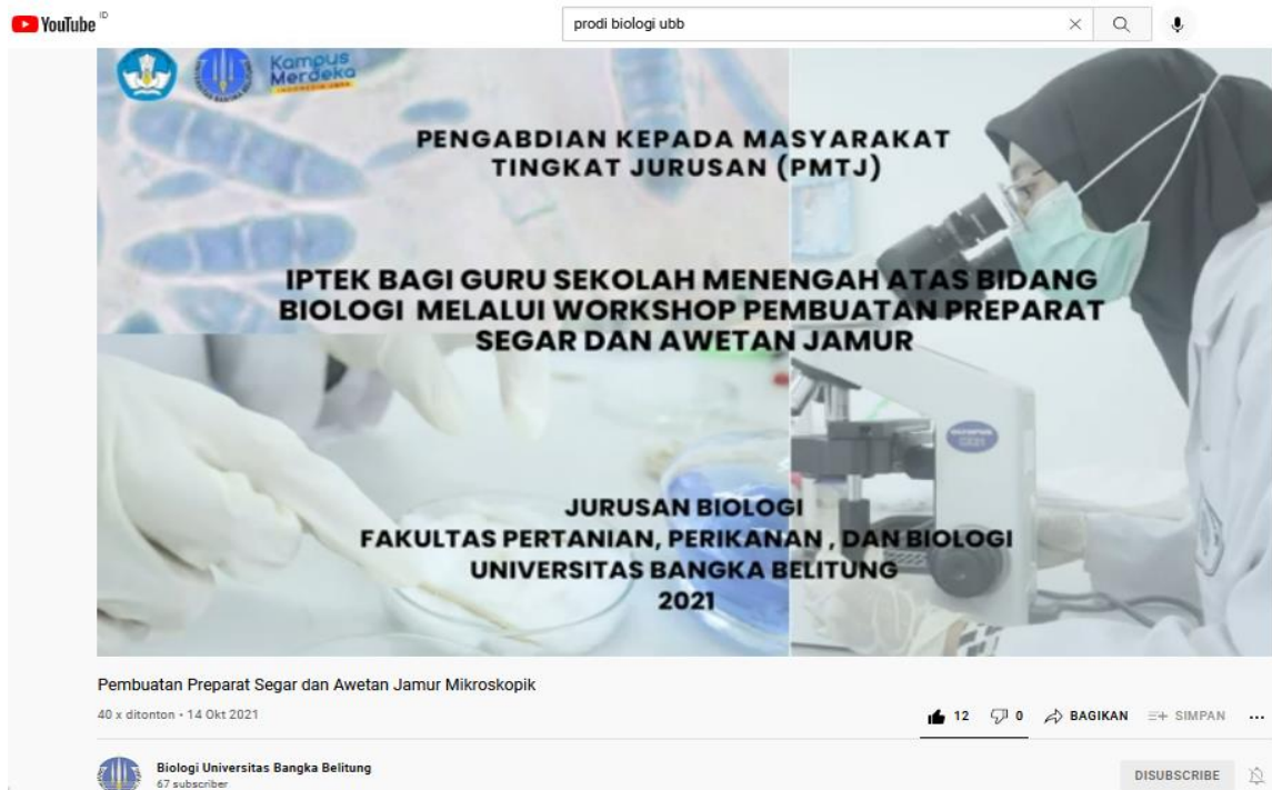
Gambar 2. Video pembelajaran tentang pembuatan preparat segar dan awetan jamur