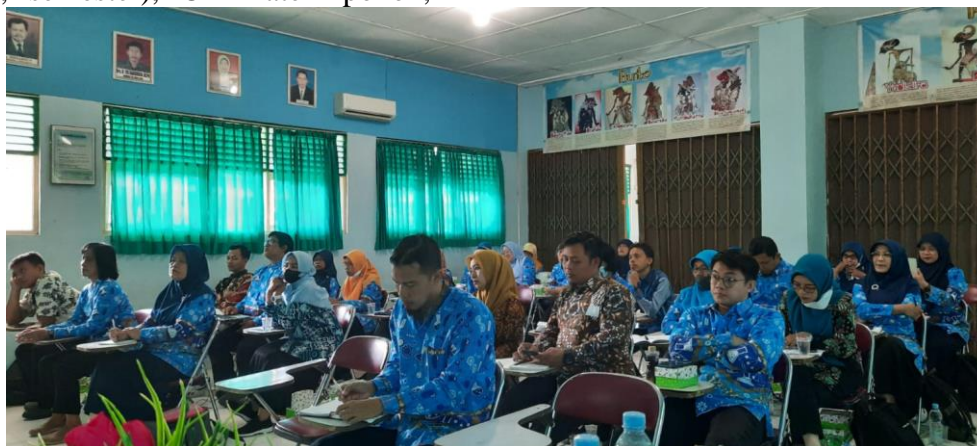
Gambar 2. Analisis materi dan pembuatan produk

tujuan pembelajaran, context sekitar yang akan diintegrasikan, Modul ajar dan LKPD yang akan dikembangkan