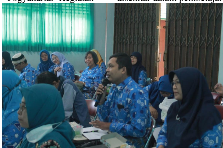
Gambar 1. Diskusi Materi

Kegiatan PkM dilaksanakan selama tiga hari di salah satu sekolah di Yogyakarta. Kegiatan