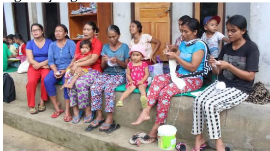
Gambar 1. Sebagian dari Kelompok Ibu Manukaya

kehidupan dunia modern. Beberapa tayangan yang ditampilkan di media sosial ataupun elektronik terkadang tidak mampu menyaring hal yang baik untuk usia anak.