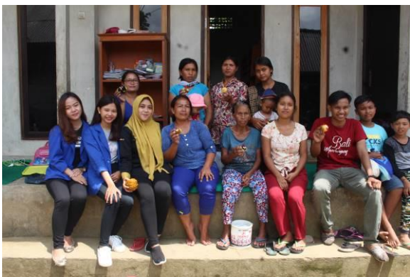
Gambar 6. Foto Bersama Kelompok Ibu Manukaya