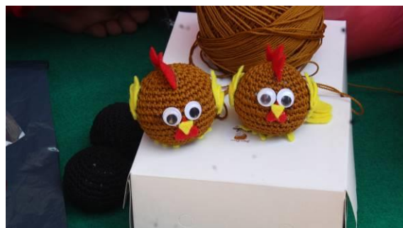
Gambar 5. Hasil Rajutan Boneka Jari