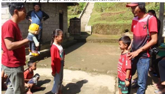
Gambar 2. Dongeng Siap Selem

Dalam hal ini, anak-anak diikutsertakan dalam melakukan dongeng Siap Selem. Kegiatan mendongeng ini diberikan kepada komunitas Bali Mendongeng dan hal ini sangat memberikan kesan positif bagi para kelompok ibu-ibu rumah tangga. Dongeng Siap Selem ini menceritakan tentang kisah ayam dan musang. Singkat cerita ayam dan anak-anak yang sedang berteduh di rumah musang, tiba-tiba mendapatkan firasat bahwa musang akan memangsa semua anak-anak ayam. Dengan usaha dan kegigihan Induk Ayam melindungi anak-anaknya, akhirnya musang gagal memangsa anak-anak dari Siap Selem. Makna dari dongeng Siap Selem ini adalah tentang kecerdasan bisa melawan niat jahat seseorang, kepamrihan seekor musang yang mau menolong hanya karena ingin memangsa anak ayam. Dongeng siap selem ini juga menginspirasi bahwa kasih sayang seorang ibu kepada anak-anaknya apapun akan dilakukan.