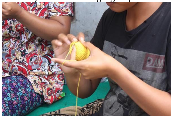
Gambar 3. Praktek Membuat Boneka Jari dari Benang Rajut

Tangga Desa Manukaya dengan memberikan pelatihan dan pendampingan pembuatan boneka jari dengan menggunakan bahan flannel dan bahan merajut. Bahan flannel ini dipilih karena tingkat pembuatan boneka cukup mudah. Selain flannel, pelatihan membuat boneka jari menggunakan bahan benang rajut. Hal ini dikarenakan melihat potensi dari ibu-ibu yang ada di Desa Manukaya yaitu merajut. Tim pelaksana dan Bali Mendongeng memberikan arahan kepada kelompok Ibu-ibu Rumah Tangga Desa Manukaya untuk membuat boneka berbahan flannel dan bahan rajut ini tema Dongeng Siap Selem.