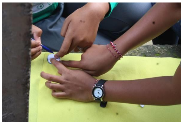
Gambar 4. Praktek Membuat Boneka Jari dari Bahan Flanel