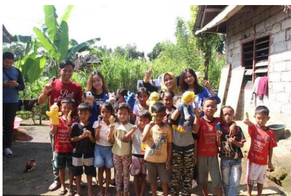
Gambar 7. Boneka Jari untuk anak-anak Desa Manukaya