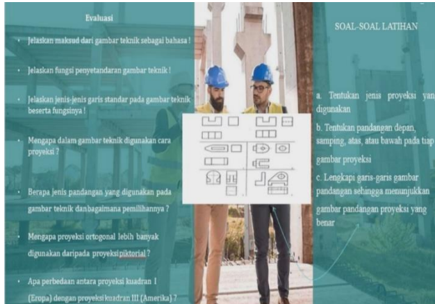
Gambar 3. Sesudah revisi