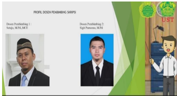
Gambar 5 Sesudah Revisi.

Pada bagian awal video terjadi penambahan berupa biodata dan foto atau nama dosen pembimbing.