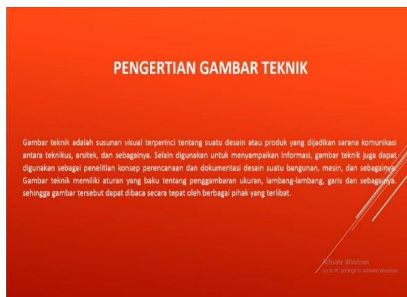
Gambar 4 Sebelum revisi

Dari segi media, hal yang harus di revisi adalah media gambar empat merupakan bagian sebelum revisi sedangkan gambar lima merupakan bagian sesudah revisi.