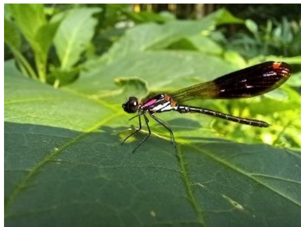
Gambar 2. Heliocypha fenestrata

terbatas [15]. Berdasarkan IUCN Red List, tiga spesies capung dari genus Drepanosticta ini masuk ke dalam kategori Data Deficient atau kekurangan data [6,7,8] oleh karena itu, spesies-spesies tersebut perlu diperhatikan secara khusus.