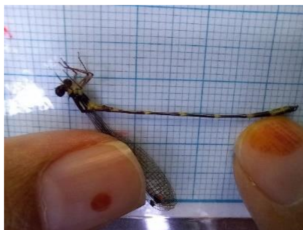
Gambar 3. Drepanosticta gazella