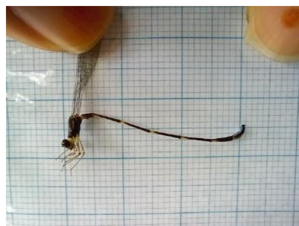
Gambar 4. Drepanosticta spatulifera