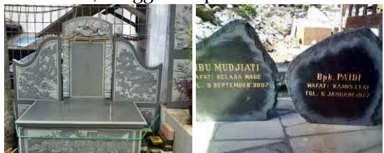
Gambar 3. Gambar Kerajinan Marmer Untuk Prasasti

Kerajinan ini dibuat dengan maksud dan tujuan sebagai penanda. Biasanya pengrajin membuat kerajinan ini jika ada pemesanan sebelumnya. Contoh kerajinan prasasti ini misalnya : papan nama, monumen, hingga sampai nisan.