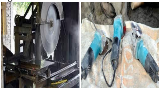
Gambar 6. Gambar Alat Untuk Membuat Kerajinan Marmer

Alat untuk membuat kerajinan marmer yang satu dengan yang lainnya juga berbeda. Dalam hal ini pengrajin marmer dapat menyesuaikan alat mana yang akan dipakai dalam membuat kerajinan marmer sesuai dengan kemampuan yang dimilikinya. Misalnya seorang pengrajin yang biasa membuat kerajinan hiasan kecil tidak disarankan untuk memakai alat sekrap yang digunakan untuk membuat bak mandi. Akan tetapi pengrajin tersebut bisa menggunakan alat yang dinamakan “mesin bubut”. Selain itu, kualitas dari alat itu sendiri sangatlah penting. Misalnya dalam proses pembuatan, pengrajin mendapati alatnya sudah rusak dimana peso yang ada di dalam sekrap sudah tumpul, maka harus diganti dengan yang baru. Karena jika tidak, batu marmer tidak akan dapat untuk dipotong dan justru akan membuang-buang bahan serta akan kerja dua kali. Ini akan memberikan kerugian tersendiri bagi pengrajin marmer, baik rugi tenaga juga rugi waktu.