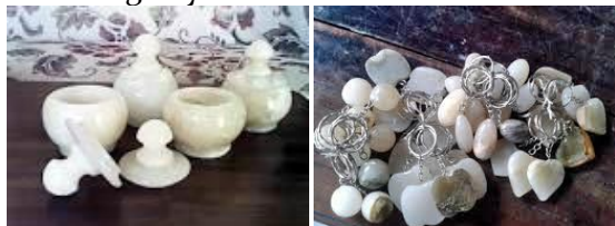
Gambar 1. Gambar Kerajinan Marmer Untuk Hiasan

dalam ruangan atau pun di luar ruangan. Jenis kerajinan ini dapat dibedakan menjadi dua macam yakni hiasan kecil dan hiasan besar. Contoh kerajinan hiasan kecil yang dimaksud misalnya : kerajinan sejenis buah dan sayur, hewan-hewan kecil, tempat cawan, fandel, gantungan kunci dan lain sebagainya. Sedangkan contoh kerajinan hiasan besar yang dimaksud misalnya : kap lampu, air mancur, guci, pigora (frame) dan lain sebagainya.