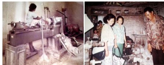
Gambar 9. Gambar Aktivitas Manjing di Gudang

dengan manjing mereka bisa berkarya sekaligus mendapatkan upah dari hasil kerajinan yang telah mereka buat apabila kerajinan tersebut laku terjual.