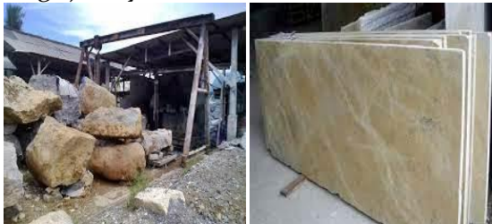
Gambar 5. Gambar Bahan Baku Untuk Membuat Kerajinan Marmer

dan dipasarkan. Jika proses dalam memperoleh batu marmer ini sulit, maka harga dari kerajinan marmer juga akan mahal. Sebaliknya jika proses untuk memperoleh batu marmer mudah, maka harga jualnya tidak akan terlalu mahal.