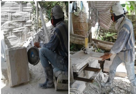
Gambar 8. Gambar Pengrajin Marmer yang Melakukan Aktivitas Manjing

Berdasarkan gambar bagan di atas dapat dijelaskan bahwa gambaran aktivitas manjing yang pertama diawali dengan pemilihan bahan yang berkualitas baik. Hal ini penting karena apabila kualitas bahan buruk maka akan mempengaruhi proses belajar dan hasil kerajinan marmer itu sendiri. Yang kedua adalah penggunaan alat yang tepat. Misalnya cara menggunakan alat untuk membentuk kerajinan marmer harus sesuai dengan yang sudah diajarkan sebelumnya, selain itu kelengkapan alat juga harus diperhatikan demi kelancaran proses belajar yakni manjing ( magang ). Yang ketiga, cara membuat kerajinan marmer harus runtut misalnya mulai dari memotong, memahat, hingga sampai menghaluskan. Hal ini penting karena apabila tidak sesuai dengan runtutan maka hasil kerajinan marmer juga tidak akan terbentuk maksimal. Yang keempat adalah penentuan lokasi pembuatan. Hal ini perlu untuk diperhatikan karena kenyamanan tempat akan memperlancar proses belajar yakni manjing.