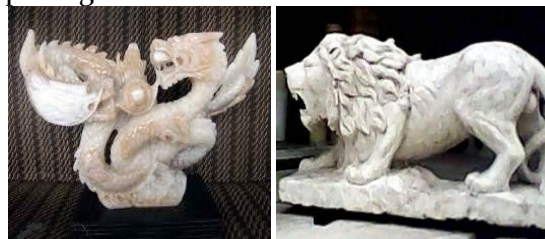
Gambar 4. Gambar Kerajinan Marmer Patung

Kerajinan ini dibuat dengan maksud dan tujuan sebagai lambang atau pun hiasan bagi peminatnya. Biasanya pengrajin juga membuat kerajinan ini jika ada pemesanan sebelumnya. Jenisnya pun ada dua yakni patung yang berukuran kecil dan besar tergantung si pemesan. Contoh kerajinan patung ini misalnya : arca, dan patung hewan.