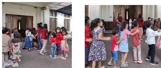
Gambar 2. Anak Mengikuti Sekolah Minggu

Peran orang Tua untuk menumbuhkan percaya diri anak usia dini untuk mengikuti sekolah minggu diantaranya: