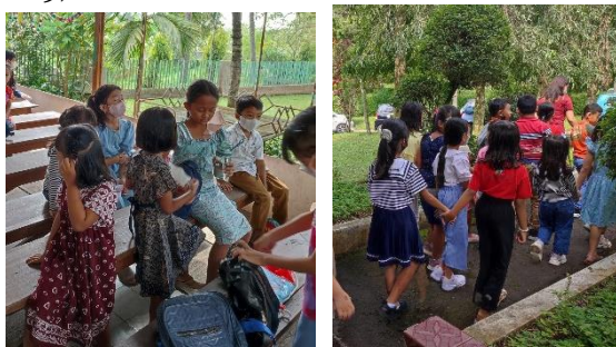
Gambar 6. Interaksi Anak dengan Teman di Sekolah Minggu

Peran orang tua dalam memupuk keterampilan sosial anak yaitu mengajarkan untuk berinteraksi dengan teman di sekolah minggu melalui berkenalan, mengajak bermain dan berbagi makanan. Hal tersebut dilakukan anak agar dapat mengakrabkan diri dan sebagai bentuk cara mereka untuk bersosialisasi dengan teman di sekolah minggu. Adanya kedekatan anak dengan teman akan membuat anak semakin nyaman dan senang saat mengikuti sekolah minggu. Adanya kedekatan anak dengan teman akan membuat anak semakin memahami baik proses penyampaian maupun proses penangkapannya (Zahroh & Jatningsih, 2019).