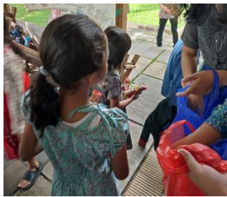
Gambar 7. Pembagian Snack di Akhir Pembelajaran