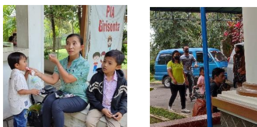
Gambar 3. Orang Tua Mengantarkan Anak di Sekolah Minggu

hadir di sekolah minggu (Pasaribu, 2019). Hal tersebut merupakan penerapan komunikasi yang baik sebagai bentuk kasih sayang atau perhatian dari orang tua (Ngewa, H. M. 2021). Anak yang rajin mengikuti sekolah minggu, tanpa harus di suruh mereka sudah memiliki kewajiban untuk mengikuti sekolah minggu. Selain itu orang tua juga memberikan pengingat kepada anak untuk selalu mengikuti sekolah minggu.