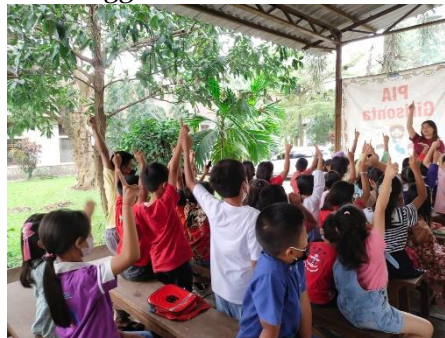
Gambar 5. Anak Berani Tunjuk Tangan

mereka mengikuti sekolah minggu. Menggambarkan suasana di sekolah minggu sangat menyenangkan. Memberikan reward yaitu memberikan makanan ringan kepada anak yang sudah mau ikut sekolah minggu. Dengan memberikan pujian atau reward kepada anak dapat memotivasi mereka untuk semakin rajin dalam mengikuti sekolah minggu.