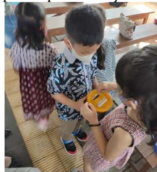
Gambar 4. Anak Membantu Membagikan Kolekte

membagikan makanan serta meminjamkan mainan yang dibawa anak kepada temannya. Melalui sikap dan tindakan yang diajarkan guru sekolah minggu dan orang tua dapat membuat anak memiliki konsep diri yang positif pada dirinya.