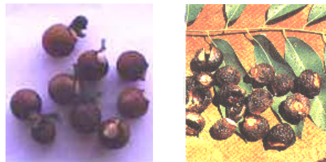
Gambar 1. Buah Lerak

dalam ketiak-ketiak daun. Buahnya merupakan buah keras, bangun bulat seringkali 1-3 buah bergandengan dan sedikit memipih pada pangkalnya.