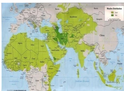
Peta Sebaran Muslimputrahermanto.files.wordpress.com

bertambah di negara-negara Muslim, tapi juga jumlah orang-orang mualaf yang baru memeluk Islam yang terus meningkat, suatu fenomena yang menonjol, terutama setelah serangan terhadap World Trade Center pada tanggal 11 September 2001. Serangan ini, yang dikutuk oleh setiap orang, terutama umat Muslim, tiba-tiba saja telah mengarahkan perhatian orang (khususnya warga Amerika) kepada Islam ( www.///:pa-tanjungbalai.net ). Sebagai pemeluk agama tentunya akan menunaikan peribadatan yang disyariatkan. Umat Muslimah wajib menutup auratnya sehingga pemakaian jilbab menjadi penting. Indonesia sebagai Negara Muslim terbesar dunia tentunya akan menjadi pusat fashionista dunia dibandingkan Negara muslim lainnya.