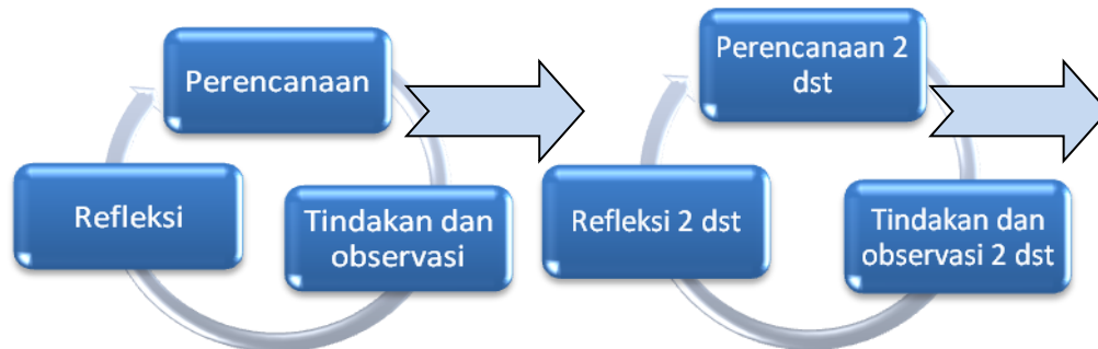
Gambar 2. Modifikasi Model Penelitian Tindakan dari Kemmis

Penelitian dilakukan di Program Studi Pendidikan Teknik Boga . Subjek penelitian ini adalah siswa 39 orang mahasiswa. Objek penelitian adalah penerapan metode inquiry dan discovery pada proses belajar mengajar mata kuliah seni penyajian makanan tahun ajaran 2013-2014 Diharapkan dengan menerapkan metode inquiry maka kreativitas mahasiswa akan meningkat.