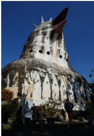
Gambar 2. Gereja Ayam

Gereja Ayam merupakan salah satu tempat lokasi Ada Apa Dengan Cinta 2 yang menjadi Trend teratas berdasarkan Sosial media dan Google Trends, yang asumsinya mewakili kepopuleritasan spot wisata AADC2 bagi pengunjung [17]. Gereja Ayam berada di Jl.Borobudur Ngadiharjo KM 4 km, Kurahan, Karangrejo, Borobudur, Magelang, Jawa Tengah. Bangunan Gereja Ayam dapat dilihat pada Gambar 2.