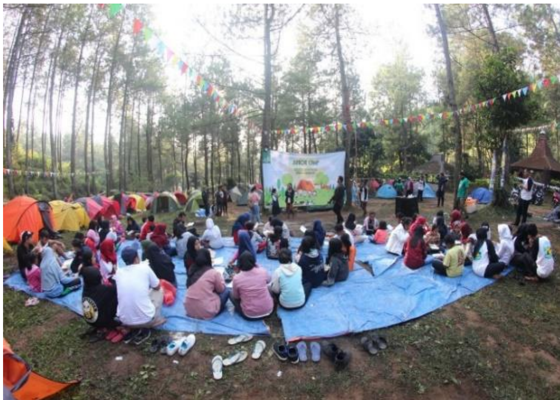
Gambar 3. kegiatan Junior Camp