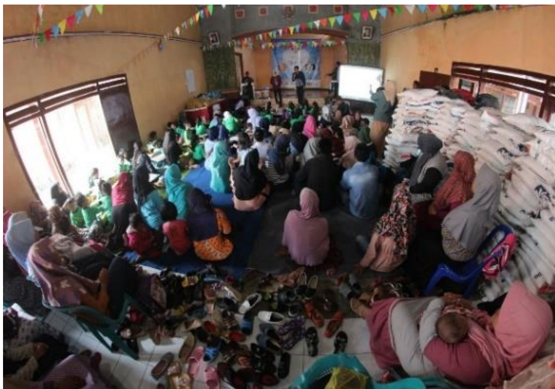
Gambar 4. Kegiatan Inklusi

Melalui kegiatan junior camp dan inklusi, menunjukkan bahwa secara tidak sadar pemuda yang tergabung dalam komunitas pemuda DNE telah melaksanakan amanat dari Undang- Undang No. 40 pasal 17 ayat 3 poin ke 3 tahun 2009. Undang-undang ini