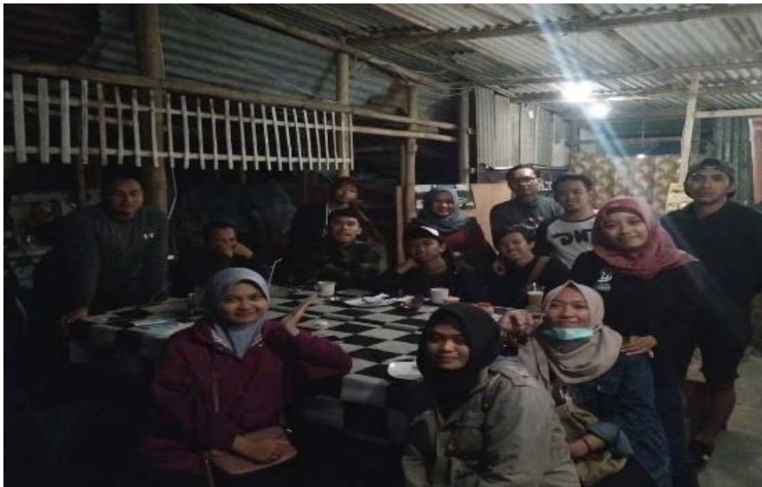
Gambar 2. Base camp komunitas DNE

Pemuda yang tergabung dalam komunitas DNE menunjukkan peran yang positif sebagai pemuda Indonesia dalam membangun masyarakat. Mereka berperan dengan mengadakan kegiatan tahunan yaitu kegiatan kemah persahabatan ( junior camp ) ( Gambar 3 ) dan kegiatan tiga bulanan yaitu kegiatan inklusi untuk anak-anak ( Gambar 4 ). Kedua kegiatan tersebut memiliki tujuan besar yaitu menanamkan pendidikan karakter peduli sosial pada anak. Nilai-nilai karakter bersahabat (komunikatif), peduli sosial dan toleransi dapat diterapkan pada kebiasaan anak ( Putri, 2011 ).